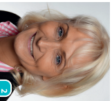
Inka Plate 2 Pädagogik Studiensekretariat Osterburg-GRK